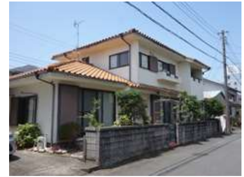
所在地: 駿東郡清水町堂庭