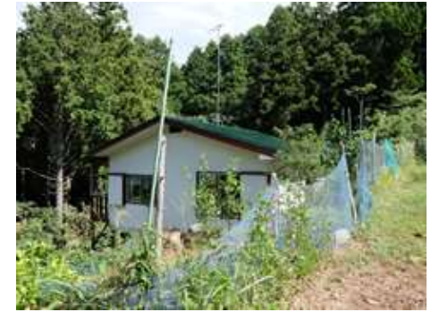
所在地: 静岡県伊豆の国市奈古谷