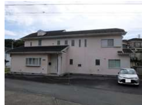
所在地: 静岡県賀茂郡東伊豆町奈良本