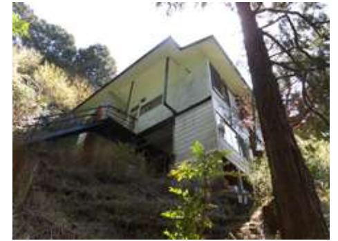
所在地: 静岡県伊豆の国市奈古谷