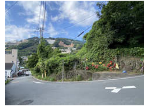
所在地: 静岡県熱海市福道町