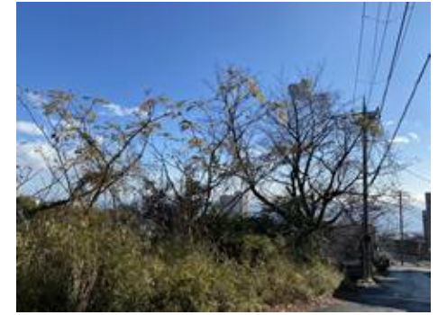
所在地: 静岡県熱海市林ガ丘町